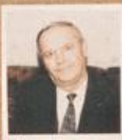
Музык А.М. 97 / 12 / 1981